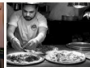
Flatbread in the making