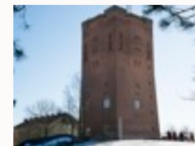
Vattentornet byggdes av Tengbom 1912

Priset består i två delar: 5 000 SEK är hyra. 30 000 SEK är minimikrav på förtäring. Räknas av mot slutnotan. För prisförslag gällande mat och dryck. Hör av er till restaurangen.